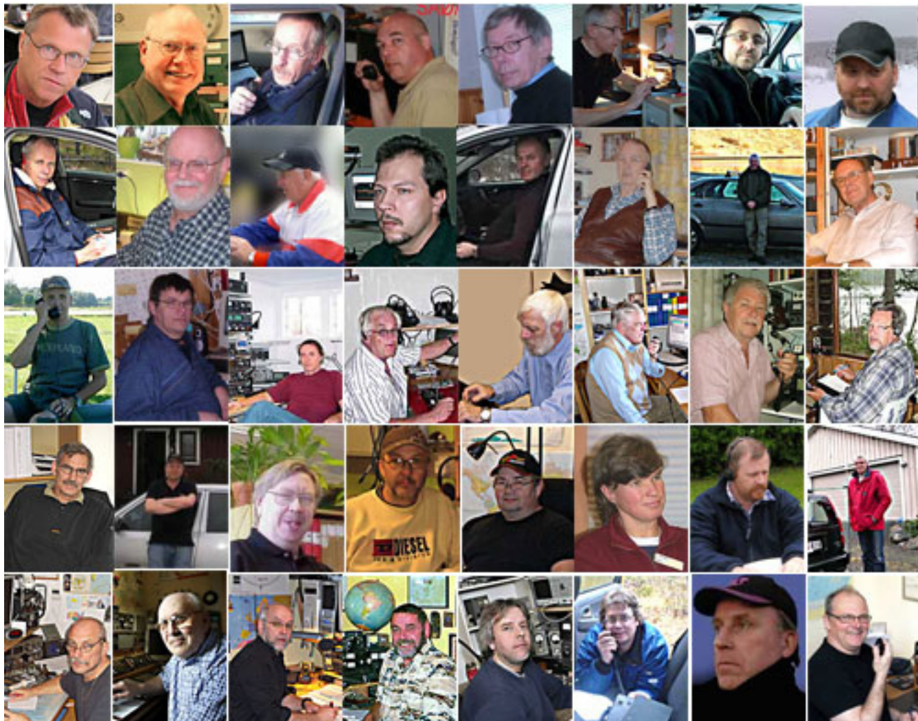
Bildkollaget ovan är inskickade bilder av några deltagande KommunJägare

Skrivet av den digitala KommunJaktens skapare och admin, Claes Nilsson / SM5FAN.